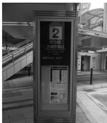
小江戸巡迴巴士 川越駅西口 2 號巴士站